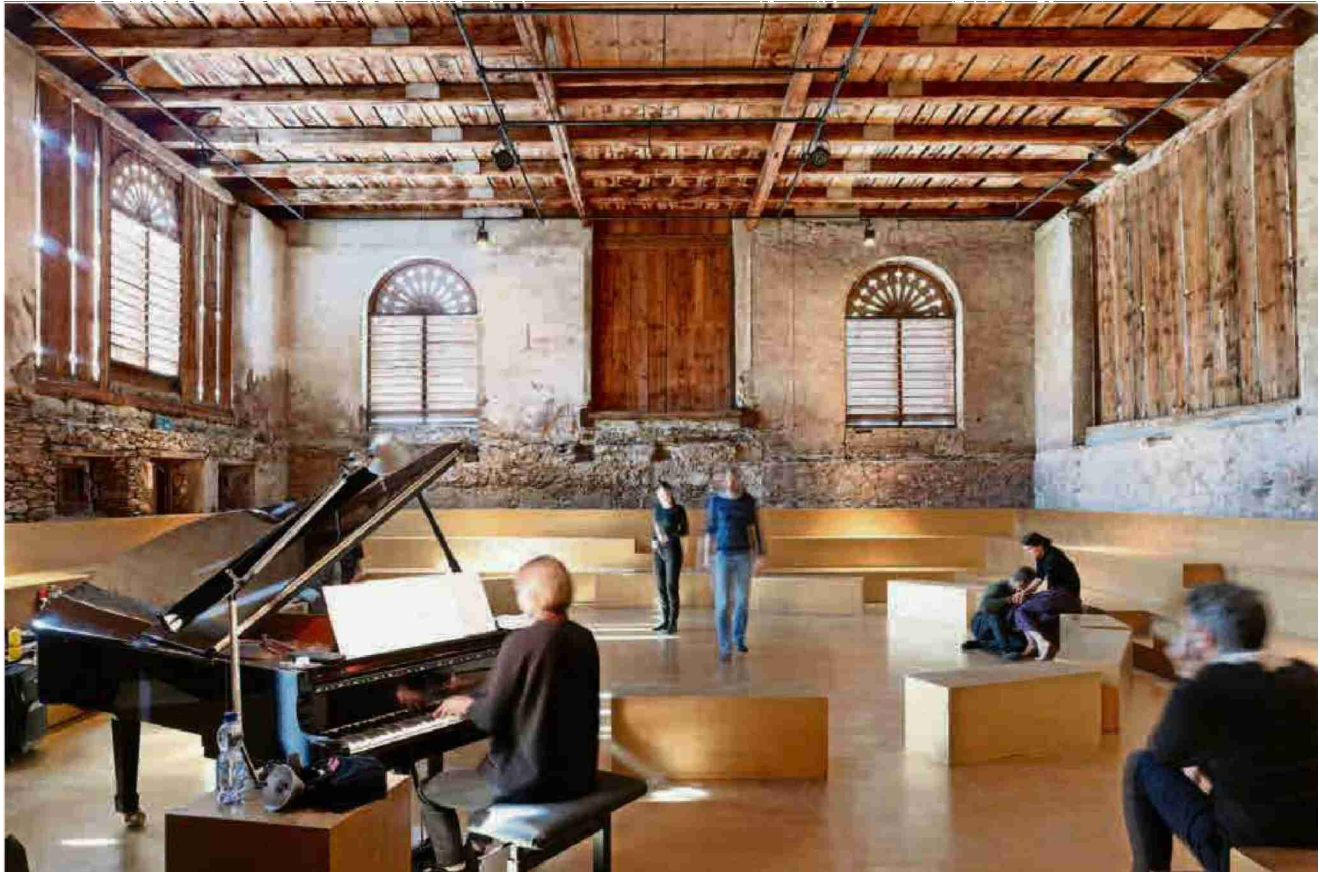
Aus dem Bauerndorf wird ein Theaterdorf: In Riom hat sich die stillgelegte Scheune in ein Wintertheater verwandelt.

RIOM Der Wakkerpreis des Schweizer Heimatschutzes geht dieses Jahr ausnahmsweise nicht an eine Gemeinde – sondern an die Nova Fundaziun Origen. Sie veranstaltet nicht nur das Kulturfestival Origen, sondern gibt dem Bündner Dorf Riom eine neue Perspektive.