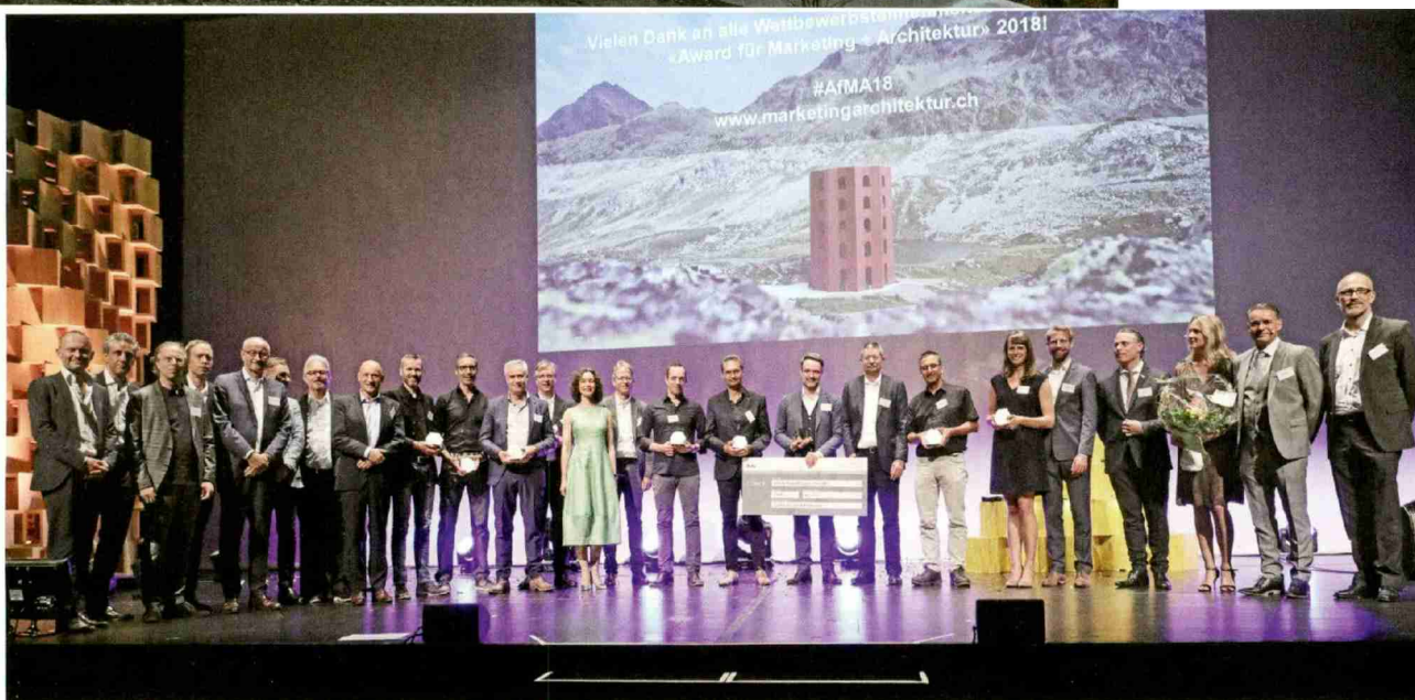
Preisträger und Laudatoren.