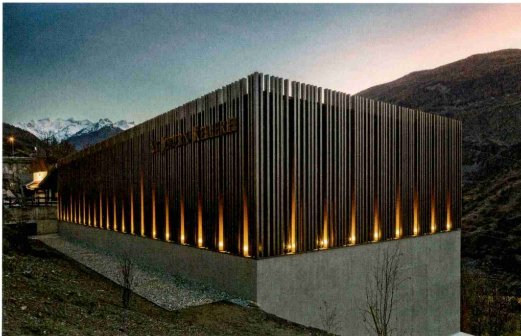
Der St.-Jodern-Keller. Architektur: Buateller 12 aus Visp.