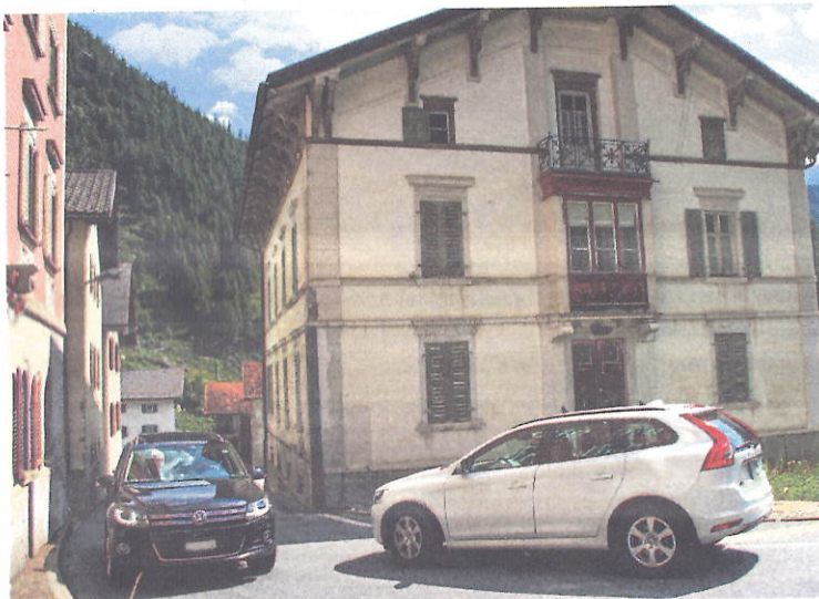
Uscheia sa preschentava la strètga agls Mulegns ier ...