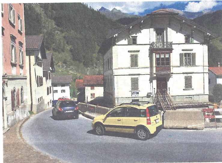
... ed uscheia sa preschainta ella oz.

G.N.S. Igl èn ossa gio set deis tgi la Villa Alva agls Mulegns è eida sen viadi e neida spustada per radond otg meters. Igl interess medial per chella spustada è sto fitg grond. Anc pi grondas èn ossa las marveglias scu tgi la strètga tras vischnanca sa preschainta siva la spustada.