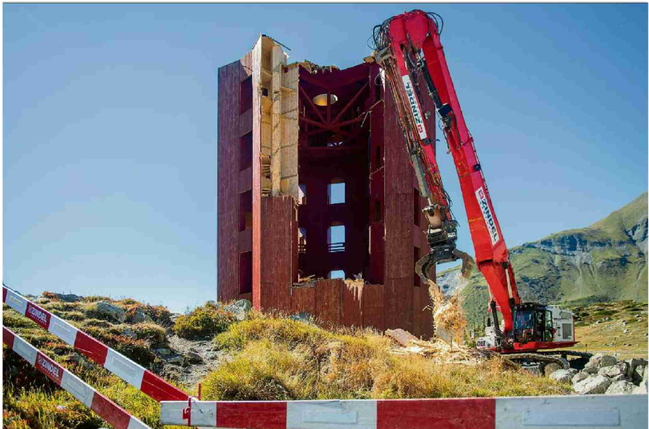
Als hätte eine Bombe eingeschlagen: Stück für Stück reisst der Abbruchbagger Teile des Julierturms herunter, allerdings gezielt und mit Bedacht.