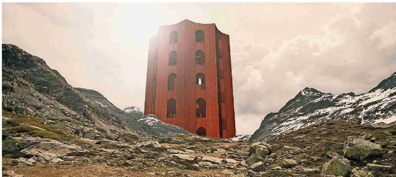
Architektur als Kunstwerk in der Julierlandschaft: Der Theaterturm für das Festival Origen.